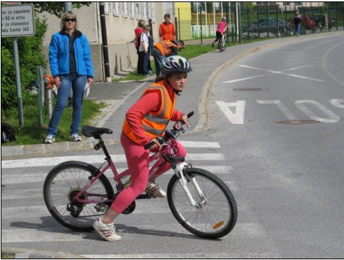
Kolesarski izpit na šoli