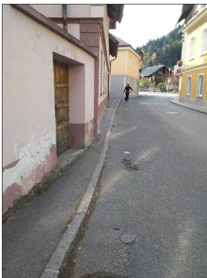
Zelo ozek pločnik (zraven cvetličarne Pušlc v Centru Črne)