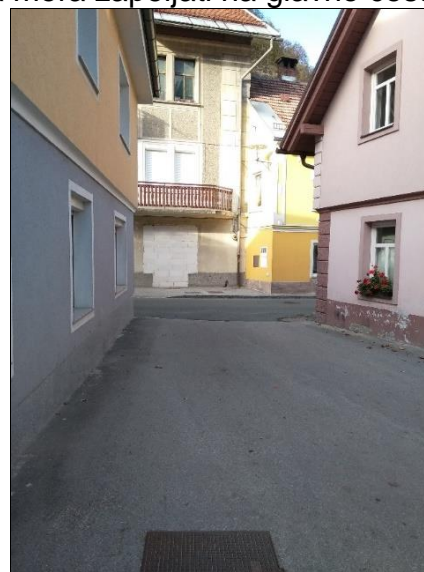
Nepregledno križišče (izvoz-Pumpas)- ni prehoda za pešce, avto pa mora zapeljati na glavno cesto