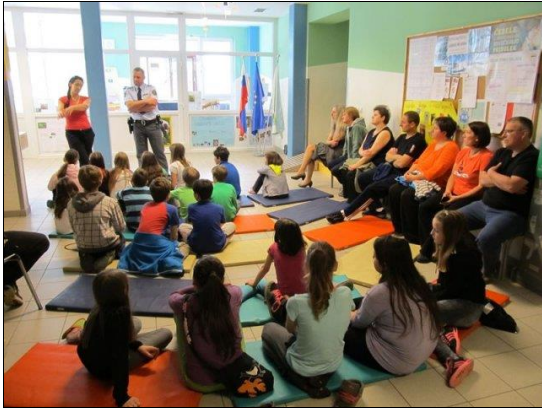
Bistro glavo varuje čelada (delavnice)