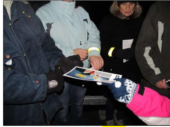
Bodi viden- bodi previden (akcija)