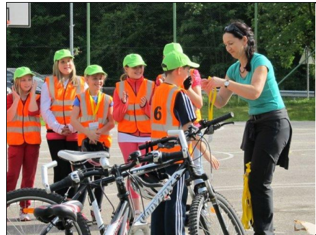
Slavnostna podelitev kolesarskih izkaznic