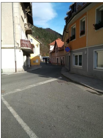
Prometni znak "prepovedano ustavljanje in parkiranje" nameščen neustrezno (pre-kratka razdalja)