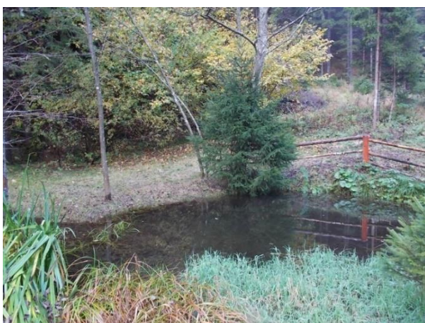
Slika 5: Naravni park Bistra