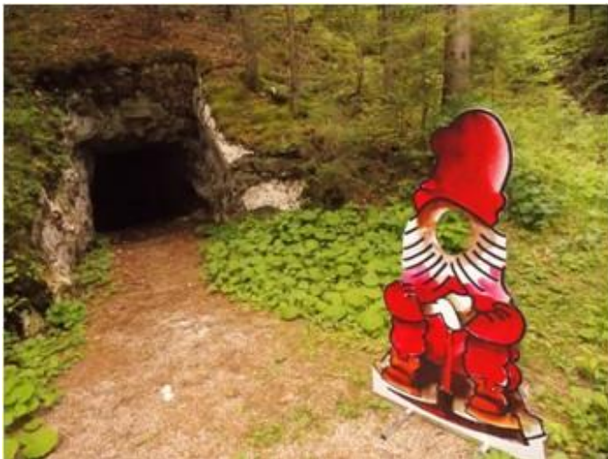
Slika 11: Perkmandeljč ob vhodu v podzemlje Pece v Haleni