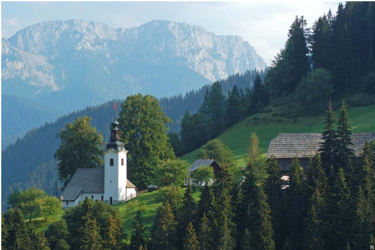
Slika 8: Sveta Ana in kmetija Jelen v Koprivni

Koprivna je naslednja lepa dolina v povirju reke Meže. Lepa gozdna cesta je speljana do Luž in do najvišjih gorskih kmetij pod Mozganovim vrhom. Cerkev sv. Jakoba predstavlja enkraten krajinski spomenik iz 14. stoletja. Na severni in zahodni strani meji Koprivna že na Avstrijo. V tej pokrajini je gotska cerkev sv. Ane. Domačija Jelen ob cerkvi je izjemno lepa kmetija, je kot enkraten narodopisni spomenik. V idilično, toda nekdanj bolj zatišno gorsko naselje so v zadnjih letih vdihnile zgrajene gozdne ceste in s tem več živahnega utripa. Tudi v Koprivni so jedro naselja velike in samotne kmetije na strmih pobočjih, ki jih obkrožajo bogati pašniki in košati smrekovi pa tudi macesnovi gozdovi. Zelo privlačne so njihove s skodlami »šiklni« krite strehe.