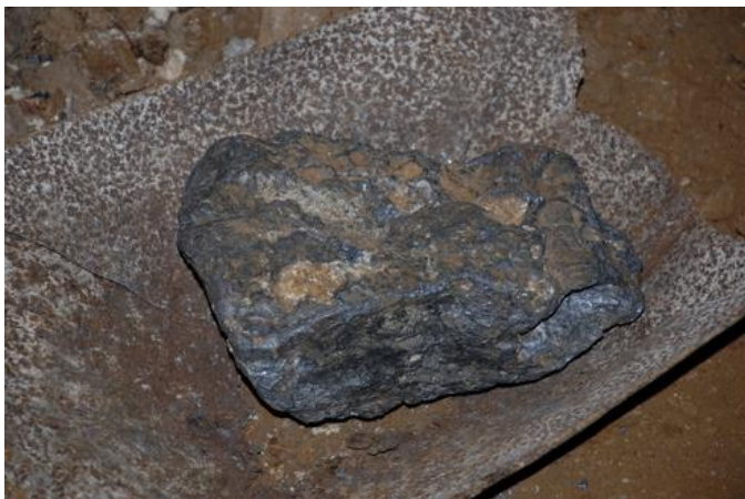
Slika 10: Galenit