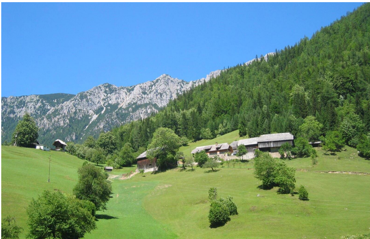
Slika 7: Kmetija Burjak v dolini Tople

Topla je čudovita alpska dolina pod južnimi stenami Pece. Zaradi svojih izjemnih naravnih lepot je zaščiten. Celoten zaselek objema visoke, mogočne in osamele kmetije Burjak, Florin, Kordež, Fajmut in Končnik, ki jih z vseh strani obdajajo obsežni, gosti smrekovi in macesnovi gozdovi. Izredno velike in mogočne kmetije v Topli so pravzaprav kar majhni zaselki; etnologi jih imenujejo »celki«. Na prisojnih legah so njive in travniki, gospodarska poslopja in hiše, na osojnih legah pa pašnik in gozd ter včasih pomožni hlev.